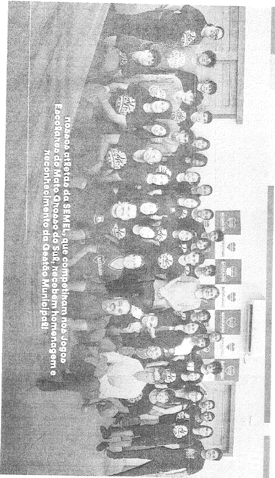
Novos atletas da SEMEL, que competiram nos Jogos Esportivos do Mato Grosso do Sul, recebem homenagem e reconhecimento do Gestão Municipal!